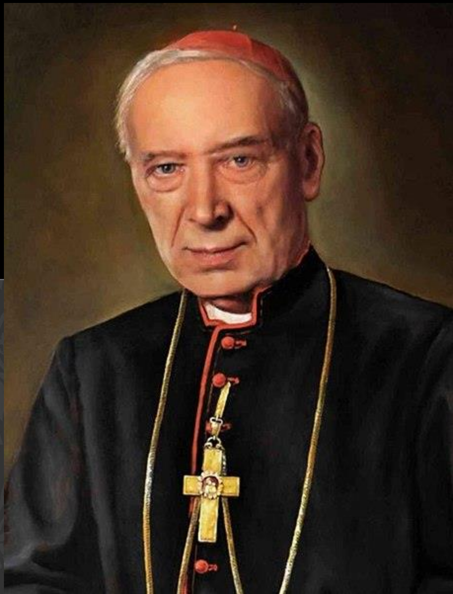
kard. Stefan Wyszyński