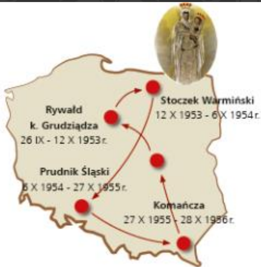
Miejsca internowania Prymasa Stefana Wyszyńskiego